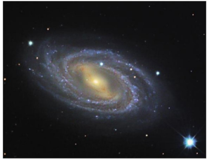
La galaxie M109 est une galaxie spirale barrée, semblable à notre Voie lactée.

Le Soleil et son système se trouvent dans la Voie lactée, notre galaxie. On peut considérer que la distance entre le Soleil et le centre galactique est constante, de valeur r = 2,7 \times 10^4 années-lumière.